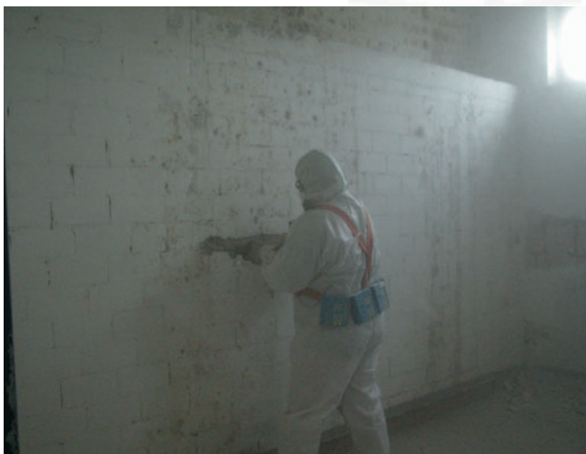
Bild 5: Beispiel für starke Sporenexposition (Gefährdungsklasse 3) beim Abschlagen von Putz ohne Absaugung

Bei sich ändernden Arbeitsbedingungen, besonders bei länger andauernden Tätigkeiten, kann sich die Gefährdungssituation ändern. Dies kann z.B. bei Entfernung von Wandverkleidungen, Entfernung von Trockenbauwänden, Entfernung von Teppichböden, der Fall sein. Hier hat der Unternehmer eine erneute Gefährdungsbeurteilung durchzuführen.