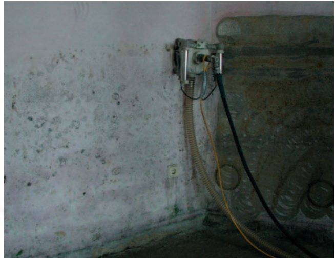
Bild 6: Besser ist es, den Schimmelpilz durch ein Sprühextraktionsverfahren zu entfernen. Dadurch verringert sich die Sporenexposition und die Tätigkeit kann in eine geringere Gefährdungskategorie entsprechend Abschnitt 5.2.1 eingestuft werden (mittlere Sporenbelastung → Gefährdungskategorie 2)