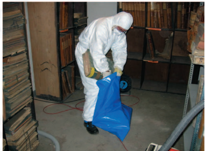
Bild 7: Beispiel für mittlere Sporenexposition (Gefährdungskategorie 1 oder 2, je nach Dauer der Tätigkeit) beim Verpacken von mit Schimmelpilzen kontaminiertem Archivgut, das zuvor oberflächlich abgesaugt wurde