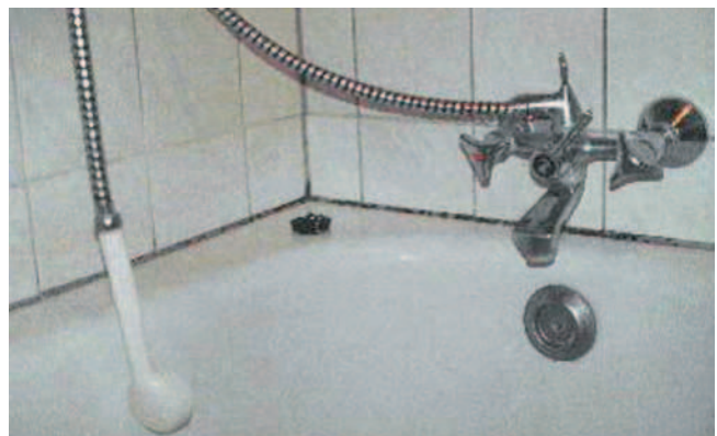
Bild 8: Beispiel für schwache Sporenexposition („Ohne besondere Gefährdung“) bei mit Schimmelpilzen befallenen Fugendichtungen